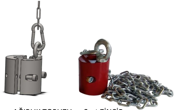
AĞIRLIK TOPUZU ve 2mt ZİNCİR